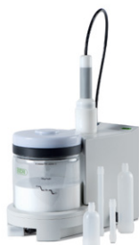
Cartridger® C-670 Подготовка флеш- картриджей