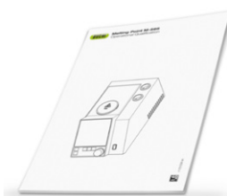
IQ / OQ for M-565 квалификационные процедуры