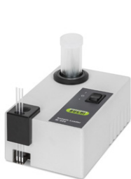
Sample Loader M-569 Эффективная подготовка капилляров