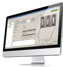
Melting Point Monitor Software Программное обеспечение для управления данными