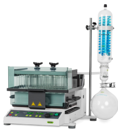
Syncore® Polyvap Обработка нескольких образцов