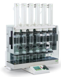
Extraction Unit E-816 SOX & HE Специальная экс- тракция жиров