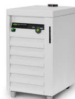
Циркуляционный охлади- тель F-305 / F-308 / F-314 Эффективный способ охлаждения, экономящий воду