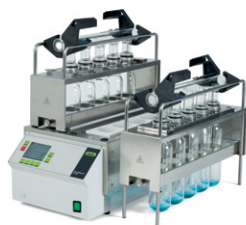
SpeedDigester K-439 / K-425 / K-436 ИК-минерализация