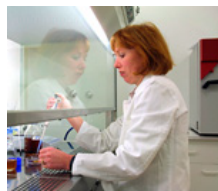
Фундаментальные исследования / научно-исследовательские институты