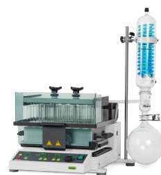
Syncore® Polyvap Обработка несколь- ких образцов