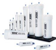
Sepacore® Flash cartridges Предварительно под- готовленные колонны