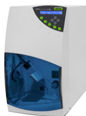
ELS-Detector C-650 Испарительный детектор светорассеяния