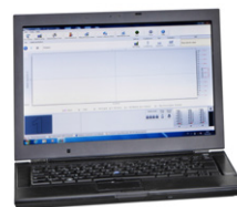
SepacoreControl Software Программное обеспе- чение для комплекс- ного управления