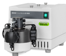
Pump Module C-601 / C-605 Насос