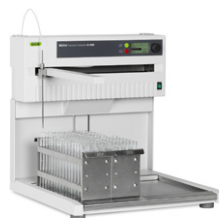
Fraction collector C-660 Сбор фракций