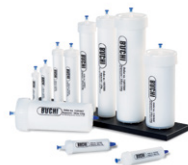
Sepacore® Flash cartridges Предварительно под- готовленные колонны